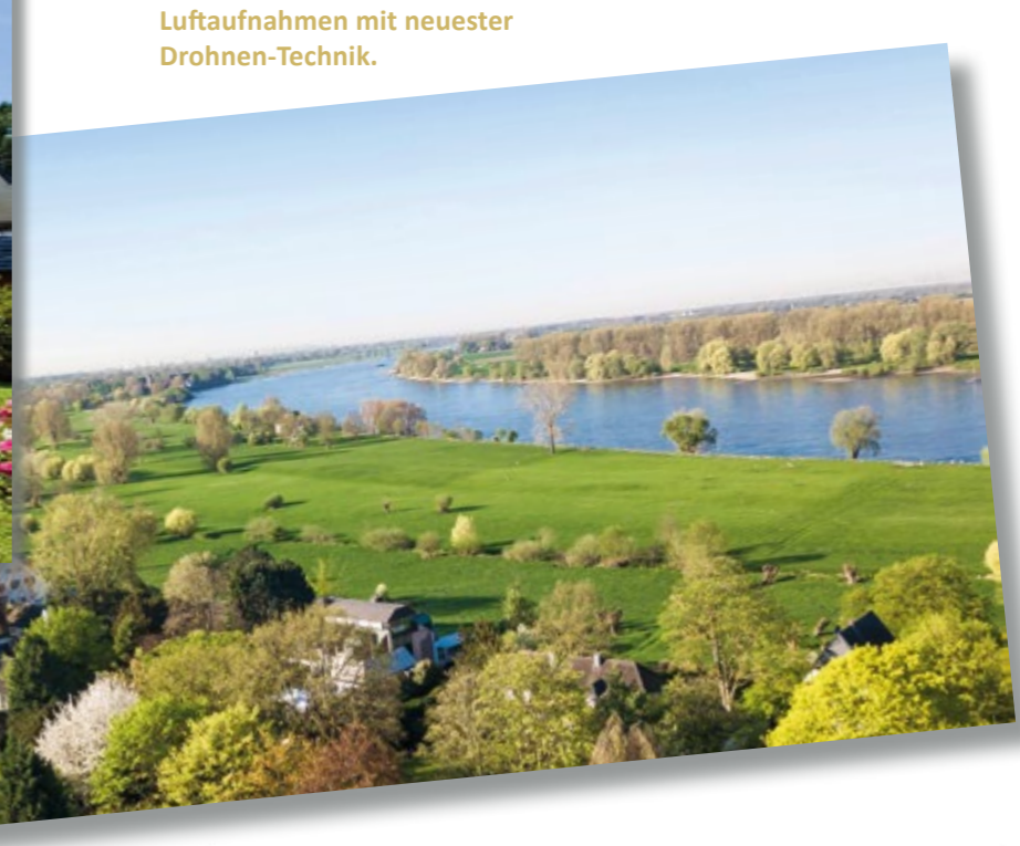
Luftaufnahmen mit neuester Drohnen-Technik.