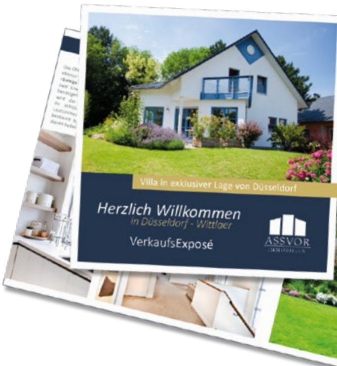
Verkaufsexposé als gedruckte Broschüre mit professioneller Objektfotografie.